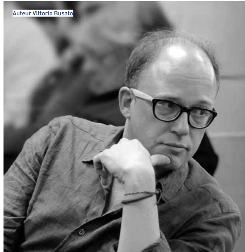
Auteur Vittorio Busato

speelde ik tot ver in de zomer Sinterklaas en Zwarte Piet. Nee, ik zou me niet weer zo laten bedonderen, nam ik me daar ter plekke op dat kerkbankje voor; laat men eerst maar bewijzen